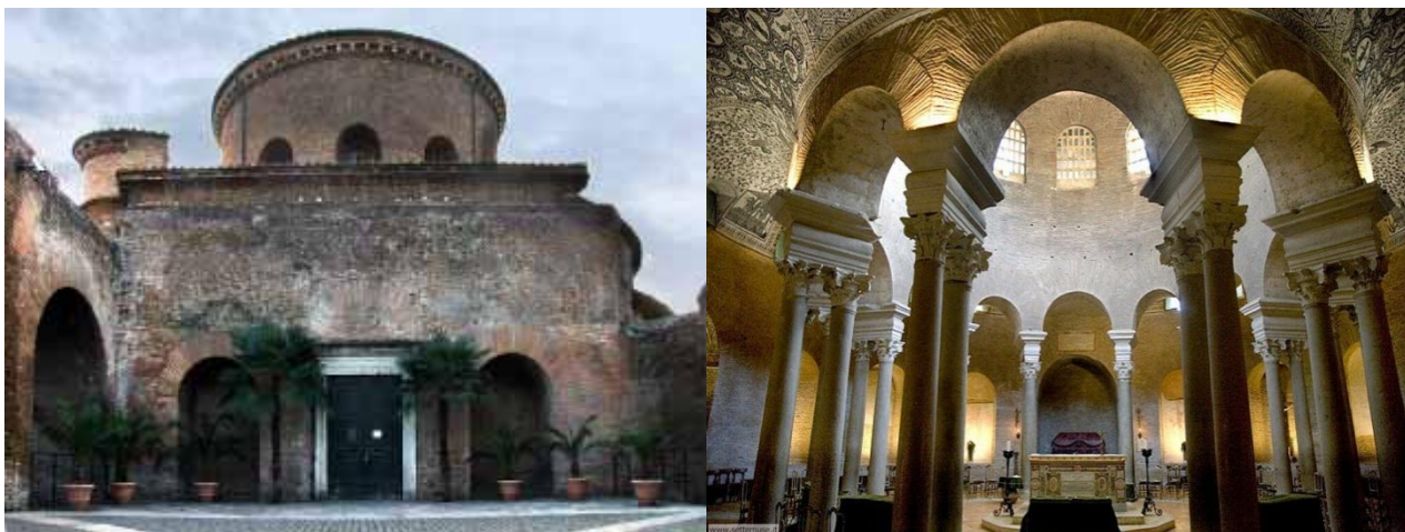
la facciata del mausoleo

Il mausoleo si trova all'interno del complesso di Santa Agnese.