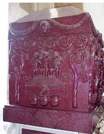
sarcofago di Costanza