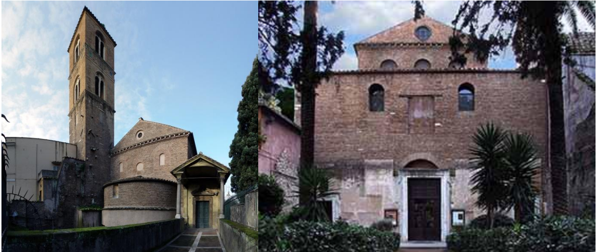
l'abside e il campanile

mausoleo = tomba molto grande costruita per conservare il corpo di un personaggio importante