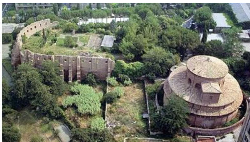
il mausoleo e i resti della basilica

La tomba di Costanzaera un sarcofago di porfido rosso, oggi nei Musei Vaticani.