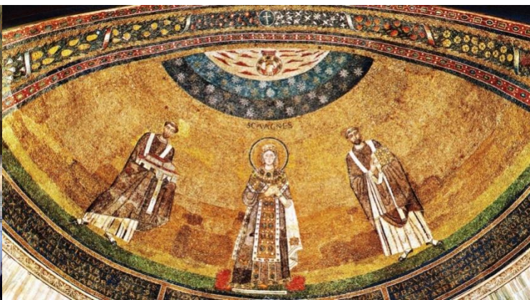
il mosaico nell'abside

Dalla basilica si scende nellacripta e nella catacomba.