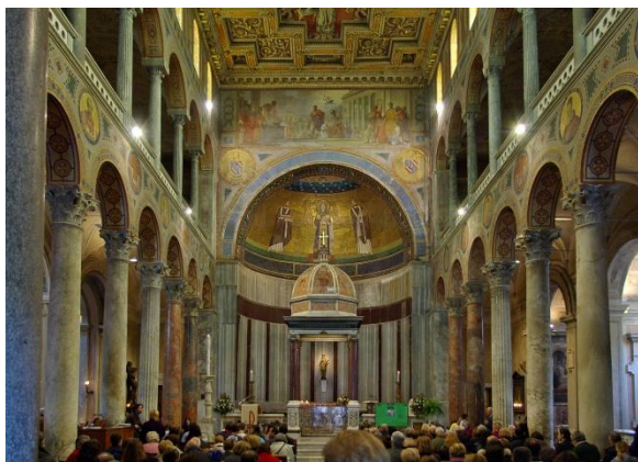
l'interno della basilica