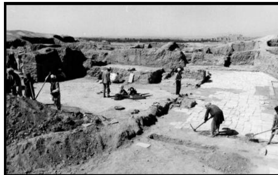
fotografie degli scavi a Ghazni

Da questo palazzo vengono i pezzi esposti nel museo: molti sono mattoni cotti, intagliati e colorati, che abbellivano la sala del trono e la corte del palazzo.