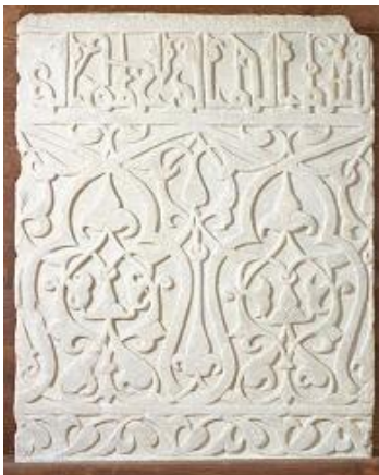
Lastra con decorazione a fiori e iscrizione

Altri oggetti sono decorati anche con la scrittura, perché quella araba è molto decorativa.